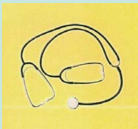
かつては班会のマスコットだった二股聴診器

群馬県沼田市にある利根保健生活協同組合の利根中央病院へ二週間のお手伝いに行つてきました。水芭蕉の尾瀬や日光の中禅寺湖へと繋がる山間の小域下町です。もう昔のことになりま