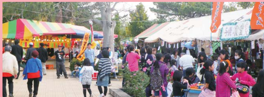
参加者は2日間で約7000名、今回、沖縄協同病院も共催し、実行委員としてまつりに参加しました。