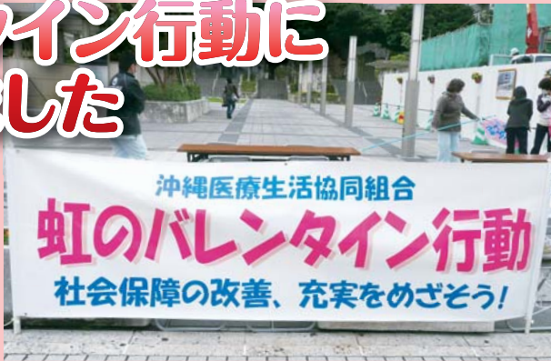
「社会保障の改善、充実をめざそう!」という訴えを行ないました

チョコレートのついたバレンタインカードは、“原発からの撤退を決断し、エネルギー改革の転換を訴える”もので、国民投票（あなたのお考えをぜひともお聞かせください）がついていました。当日は風が強く寒い中、足早に通り過ぎる人が多かったのですが、中には「家族全員原発に反対しています」、「関心あるので友人と話しています」などの生の声が聞かれ、若い方から年配の方まで関心があるということを実感いたしました。