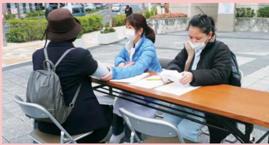
「虹のバレンタイン行動」とは、バレンタインデーの前後に『社会保障の改善』を訴え、街角健康チェック等を行う取り組みです。

一方、医療福祉生協についてご存知でしたか?の問いに対して、「聞いたことはあるような?よく知らない」という答えがほとんどでした。認知度はまだまだ低いですね。