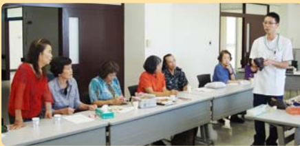
リハビリスタッフによる自助具の紹介

『のぞみの会』では患者様同士の交流だけでなく、スタッフにとっても一緒に勉強しながら、患者様の思いや意見を聞いてより良い方法を目指すことのできる、良い機会だと感じることができました。