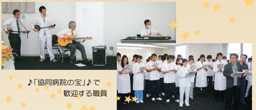
♪「協同病院の宝」♪で歓迎する職員